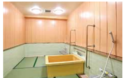
広くて、ひのきの香りのよい浴室