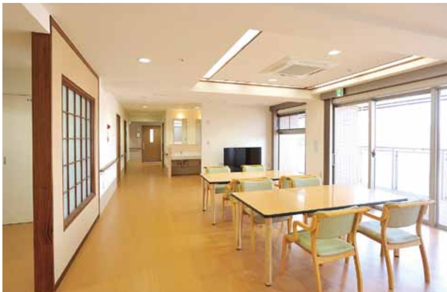
光のたくさん入る食堂

少人数の認知症の方とスタッフによって、安定的な人間関係のもとで共同生活を送ることにより、落ち着いた生活を営むことを支援するところです。